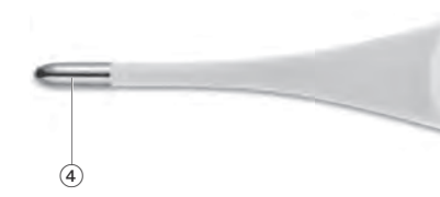
IB MT 850 S-V10 3717